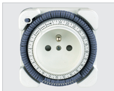
TT 26, 24 uur-programmering