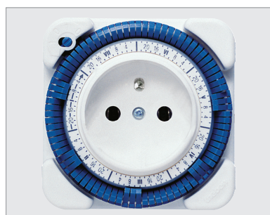
TT26W, 7 dagen-programmering

De tijdschakelaar is een elektromechanische timer voor montage rechtstreeks in een 230 V-stopcontact. Hij is voorzien voor sturing van elk elektrisch apparaat van maximum 3500 W. De programmering vindt plaats d.m.v. kantelsegmenten.