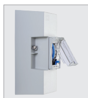
907.0.065 (CB-E8), set met klemmenafdekking