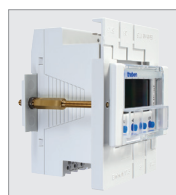
907.0.001, set voor inbouw- montage