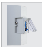
907.0.065 (CB-E8), set met klemmenafdekking