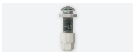
907.0.456, lichtsensor (inbouwmontage)