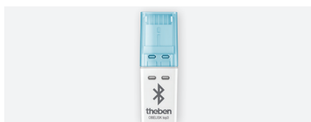
OBELISK top3, steekbaar geheugen Obelisk top3