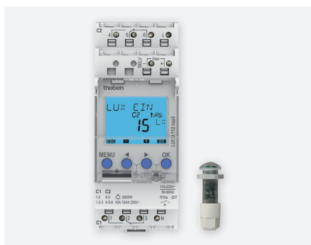
LUNA 112 TOP3 EL