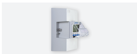
907.0.064 (CB-TR2), klemmendeksel