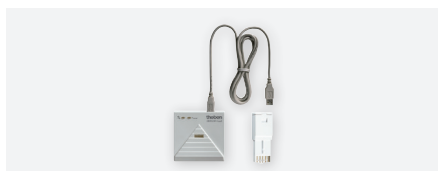
907.0.409, Obelisk programmeerset