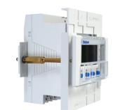
907.0.001, set voor inbouwmontage