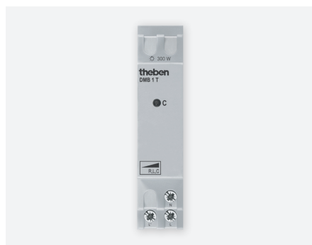
DMB 1T KNX