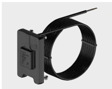
ANTENNE RC-GNSS R