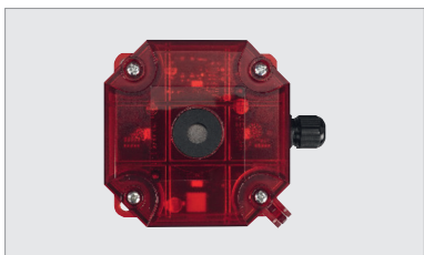
ACC SRL 230,

knipperlicht 6 W + sirene 100 dB, 230 V AC