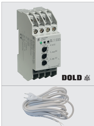
KIT IL RAIN