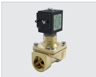
21HT5ZOY160-BDA230AC-305, 2-weg magneetventiel 3/4", NO, 230 V AC, 8 W, NBR