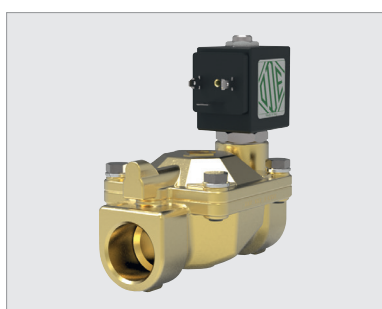
21W4ZB250-BDA230AC-305, 2-weg magneetventiel 1", NO, 230 V AC, 8 W, NBR