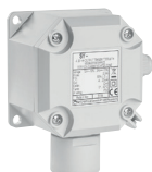
Gassensor te kiezen volgens het te detecteren type gas

1 Automatische zekering 6 A te beveiliging van de centrale