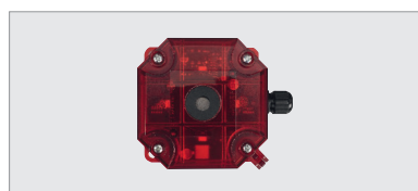
ACS230, knipperlicht en sirene