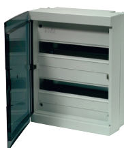
Schakelbord met doorzichtige deur