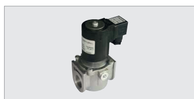
EVG 230 NCA 034, normaal gesloten magneetventielen met automatische reset