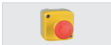
EMERGENCY STOP, noodstopknop