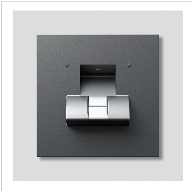
Fingerprint module FPM 600-0 DG 210009609-00