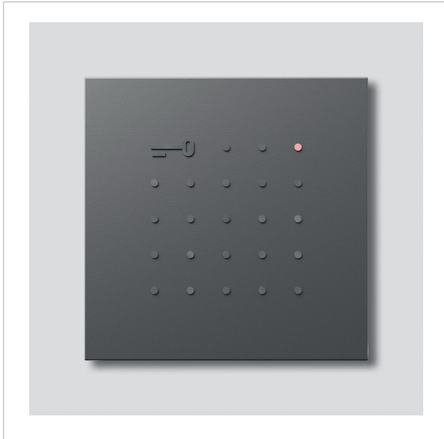
Electronic Key leesmodule ELM 600-0 DG 210008427-00