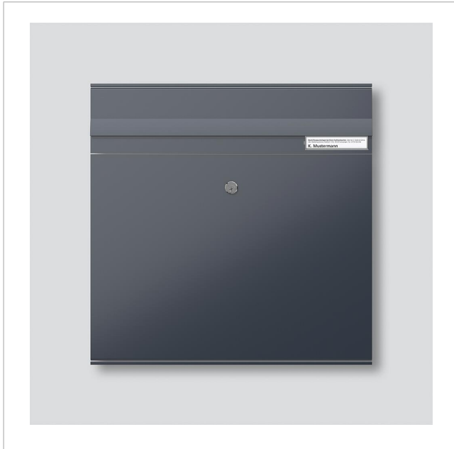
Brievenbusmodule met inwerpklep BKM 611-4/4-0 AG 210005016-00