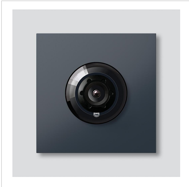
Systeemvrije Camera 130 voor Siedle Vario CM 613-03 AG