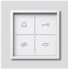
Toestandsweergave module ZAM 670-0 W