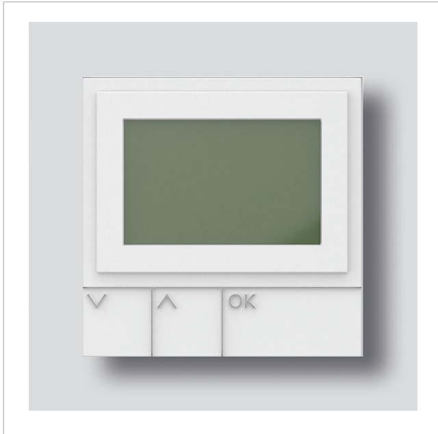
Display oproepmodule DRM 612-02 W