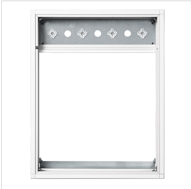
Combiframes KR 614-1/1 SM 200040853-00