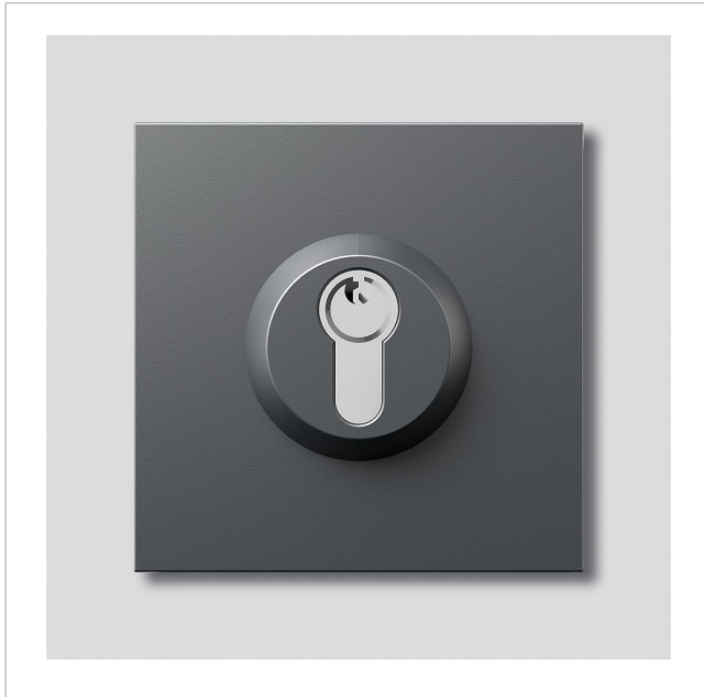
Slot-module SM 611-01 DG 200038905-00