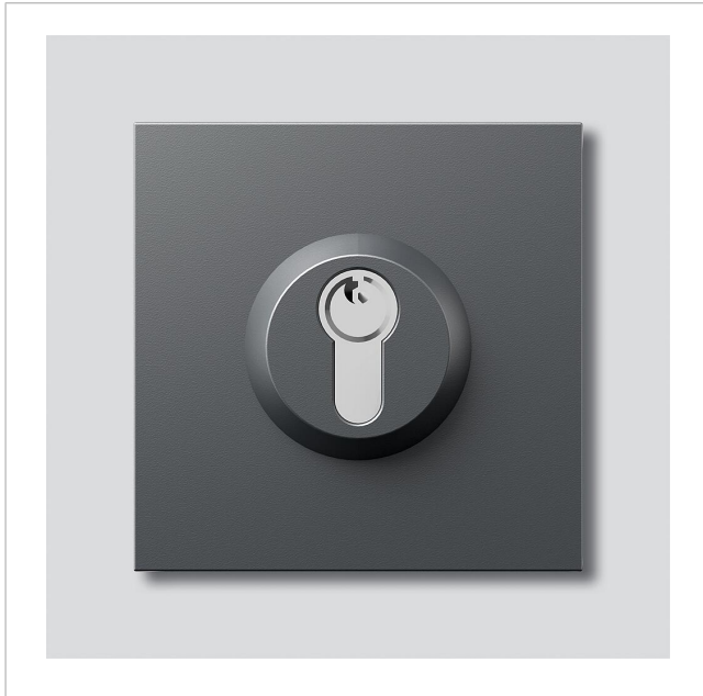
Slot-module SM 611-01 DG 200038905-00