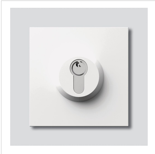
Slot-module SM 611-01 W 200019404-01