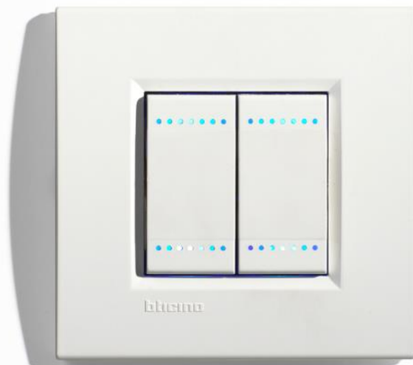
Bticino® SWC04/N Light

lichtsterkte en het al dan niet knipperen van de LEDs op de tweede pagina van de schakelaar kan worden bepaald via de software.