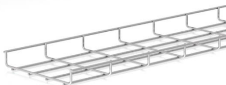
afbeelding 35x60 en 35x200 mm