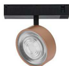
MAT ZWART - MAT KOPER