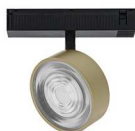
MAT ZWART - MAT MESSING