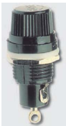
Foto e disegno (dimensioni in mm) / Product image and drawing (dimensions in mm)