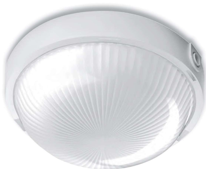
VEGA 1x100W OPAL