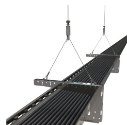
Met de UniGrip Y-Fit