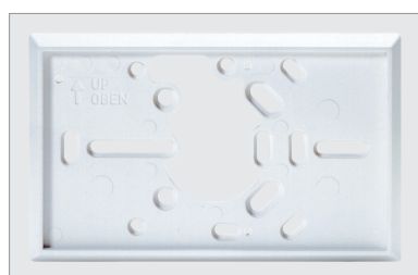
007.63.2488.001 (ARA 1.7 E), montageplaat op inbouwdoos