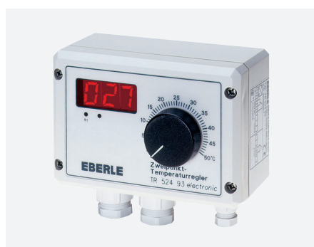
0524.93.140.000 (TR 52493)