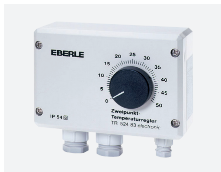
0524.83.140.000 (TR 52483)