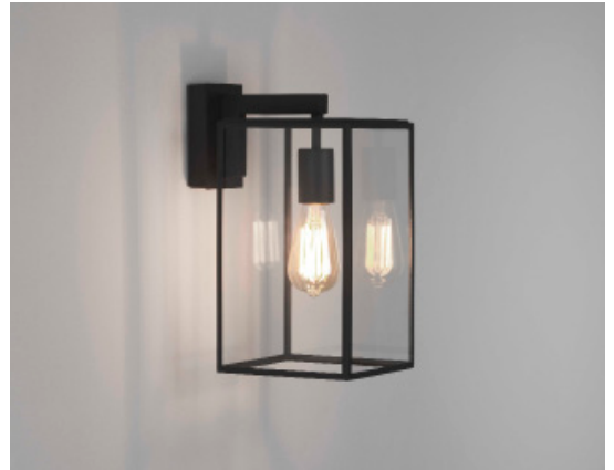
CODE: 1354004 FINISH: TEXTURED BLACK

THIS PRODUCT IS NOT SUITABLE FOR INSTALLATION WITHIN FIVE MILES OF THE COAST. FOR THESE ENVIRONMENTS, PLEASE FILTER PRODUCTS ON THE ASTRO WEBSITE BY 'COASTAL'.