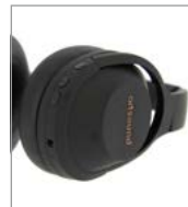
ruisonderdrukking met één toets